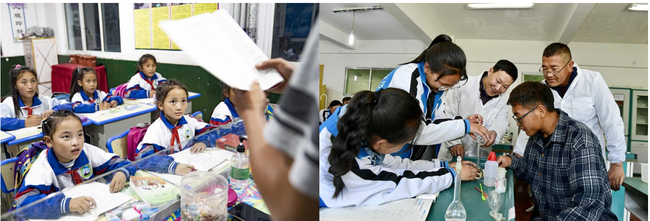
A gauche : Des élèves suivent un cours dans la ville de Qamdo de la région autonome du Tibet, le 14 septembre 2020. A droite : Un enseignant du Hubei et un enseignant local dirigent des élèves dans une expérience de chimie au lycée n° 1 de Shannan, dans la région autonome du Tibet, le 7 mai 2019.

A l'inverse, l'enseignement supérieur chinois est prioritairement axé sur le développement accéléré des sciences et techniques et est donc directement orienté vers l'effort de montée en gamme technologique tous azimuts du pays ! Pour la jeunesse chinoise fraîchement diplômée, l'incertitude du lendemain est aujourd'hui un sentiment inconnu. Quant aux étudiants et aux jeunes diplômés occidentaux, leur perspective générale se résume aujourd'hui en ces quelques mots : précarité et chômage croissants !